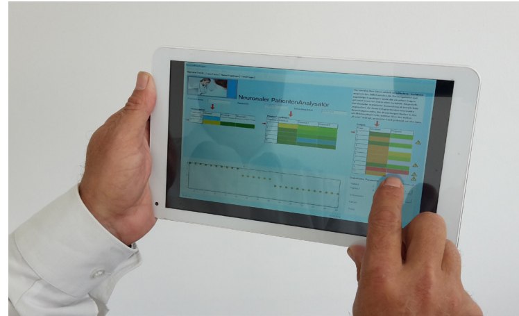
360° Analyse eines Diabetespatienten 360° Analysis of a Diabetes Patient

Diese softwarebasierten Patientenfingerprints ermöglichen es, Veränderungen im Zustand und Verhalten frühzeitig aufzuzeigen, um Patienten gezielt zu therapieren, zu motivieren und sie und ihre Umfeld zu unterstützen.